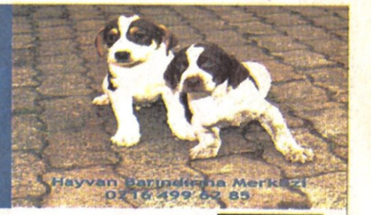
Hayvan Barınakına Merkezi 0216 499 53 85